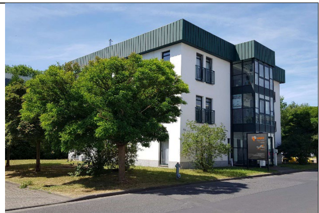
Blick auf den neuen Geschäftssitz der ARJES GmbH am Standort in Merkers, Thüringen