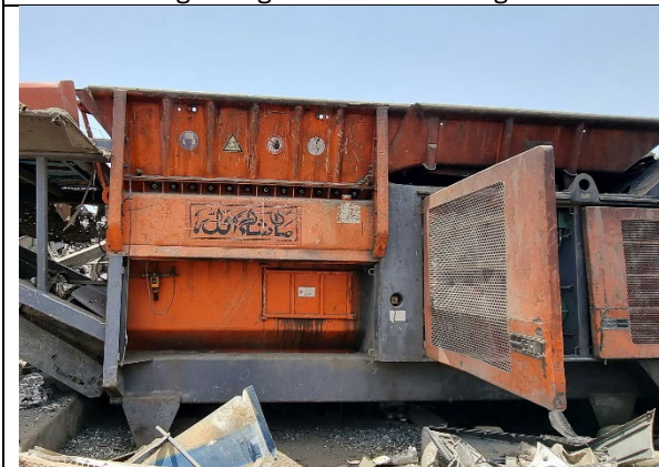
Mehr als 12.000 Betriebsstunden konnte der VZ 950 von ARJES bereits erfolgreich laufen