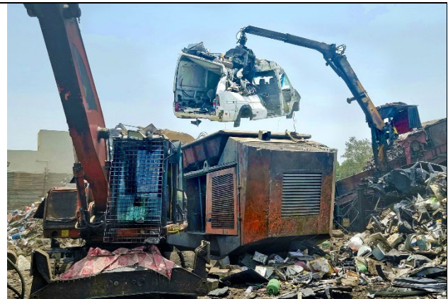
6 Tage die Woche im Einsatz bei der Zerkleinerung von Autokarosserien