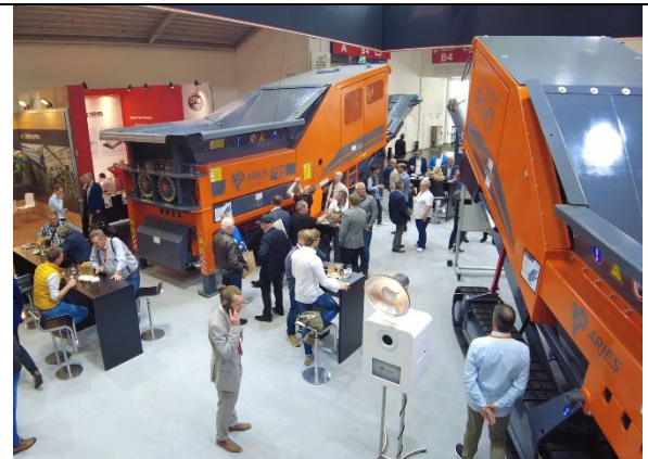
Impressionen vom ARJES Stand auf der IFAT 2022