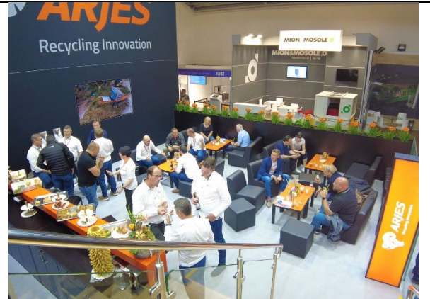
Impressionen vom ARJES Stand auf der IFAT 2022