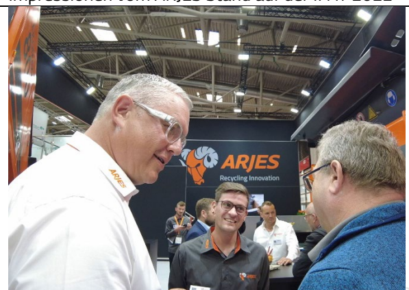
Impressionen vom ARJES Stand auf der IFAT 2022