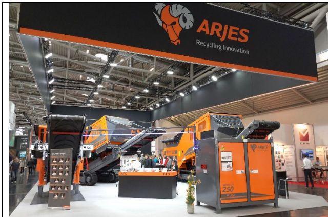
Impressionen vom ARJES Stand auf der IFAT 2022

Presseveröffentlichung: 20.05.2022