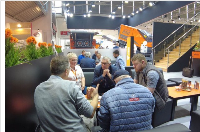
Impressionen vom ARJES Stand auf der IFAT 2022