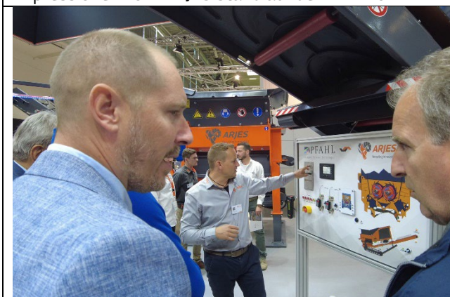
Impressionen vom ARJES Stand auf der IFAT 2022