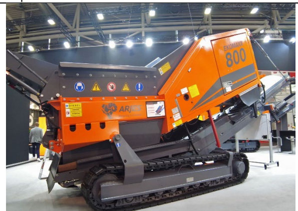
Impressionen vom ARJES Stand auf der IFAT 2022