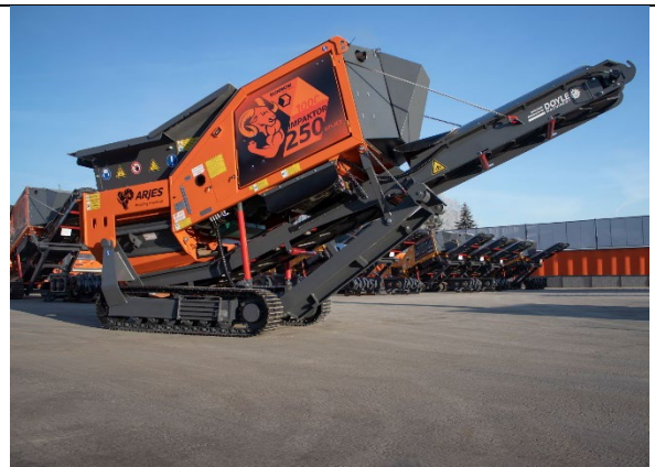
Der kompakte Zweiwellenzerkleinerer im Special Dunmow-Design auf dem Werksgelände der ARJES GmbH