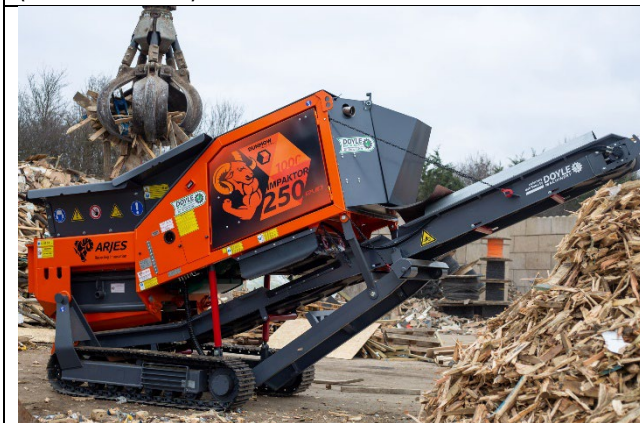
IMPAKTOR 250 evo beim ersten Testlauf – Zerkleinerung von Altholz