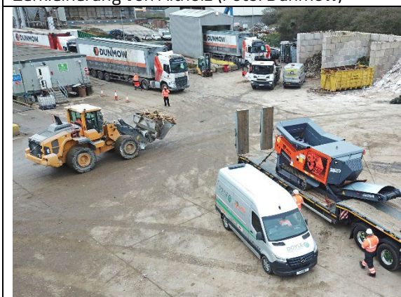
Anlieferung auf dem Recyclinghof von Dunmow in Chelmsford